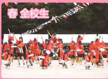
ファミリースポーツデー