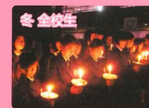
クリスマスセレモニー