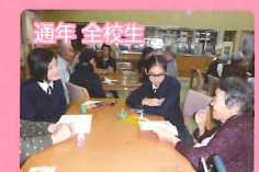
ボランティア活動