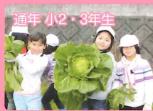
食育・エコロジー活動