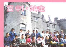
海外語学研修旅行